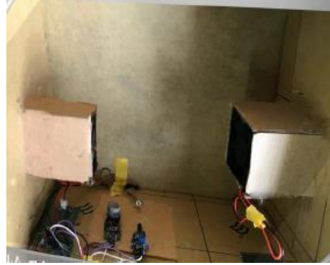
检测装置内部结构